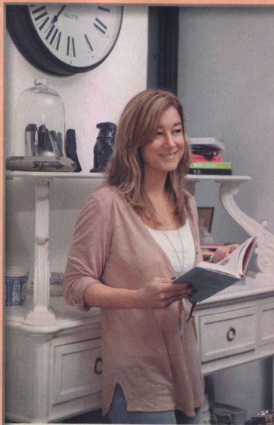
Realizada en M1 Calle de Nueva York. www.micadedenyes.com

Las Eaux de Diptyque son ocho fragancias de esta casa francesa que se dividen entre Florales y Hespérides . Eau de Lavande es una de ellas (64 €/50 ml).